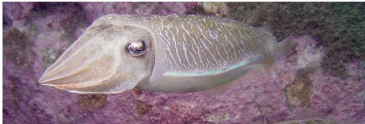
Auch Sepia gehört zu den Arzneimitteln, die einen Bezug zur Prostata haben.