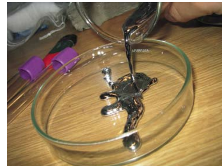
Im Beispielfall wurde Mercurius u.a. verordnet wegen der Prostata Entzündung, sehr starker stechender Schmerzen und der Verzweiflung, die zu Selbstmordgedanken führte.

Schwierigkeiten ergeben sich, wenn eine Symptomenarmut besteht, es sich also um eine einseitige Erkrankung handelt. Oft scheint dies der Fall zu sein;