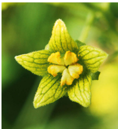
Coxalgie und Coxitis – Werner Dingler