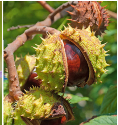
Aesculus hippocastanum